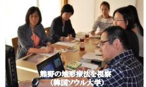
熊野の地形療法を視察 (韓国ソウル大学)