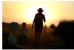
サンティアゴ巡礼の道