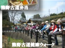
熊野古道健康ウォーク