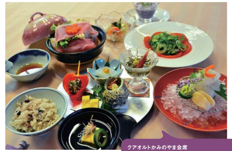
クアオルトかみのやま会席 ●カロリー:711kcal ●塩分:3.5g ●野菜:308g

月岡ホテルは、インバウンドの需要を見据え、外国人観光客も積極的に受け入れ、国内外の来訪者に対して“心も体も元気になれる”上山での体験を提供しています。その一つとして季節の食材から、みそ・しょうゆにまで地元産にこだわり、カロリーと塩分、バランスに配慮された山形ならではの郷土料理を楽しめる会席を提供。ゆっくり噛んで素材の味を楽しんで食べる工夫やいつもの食事とのギャップなども含め、すべてが参加者の「健康への気づき」のきっかけにつながります。