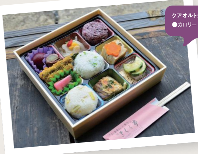
クアオルト弁当 ●カロリー:600kcal ●塩分:3g以下

「クアオルト弁当」とは、上山の旬の食材をふんだんに使用した栄養バランスのとれたお弁当。「①上山産米の使用②上山産農産物を活用したおかず2品目以上の使用③産地記載のおしながきの添付」の3つを条件とし、イベントや会議、ツアー等で提供されています。