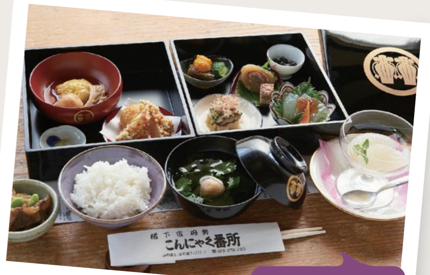
クアオルトこんにやく会席箱膳 ●カロリー:416kcal ●塩分:2.6g

誰もが驚く蒟蒻懐石を提供する檜下宿の人気こんにやく料理店。こんにやくは、食物繊維やカルシウムが豊富。さらに腸を掃除し、便秘にも良いとされる食べ物！そんなこんにやくを独自の技術で、様々な料理を味付けや食感、見た目まで再現し、クアオルトこんにやく会席箱膳として提供しています。驚きや楽しさあふれる料理には、「食から健康への気づき」という社長の思いから、普段の食事にも活かせる調理の工夫が盛り込まれています。