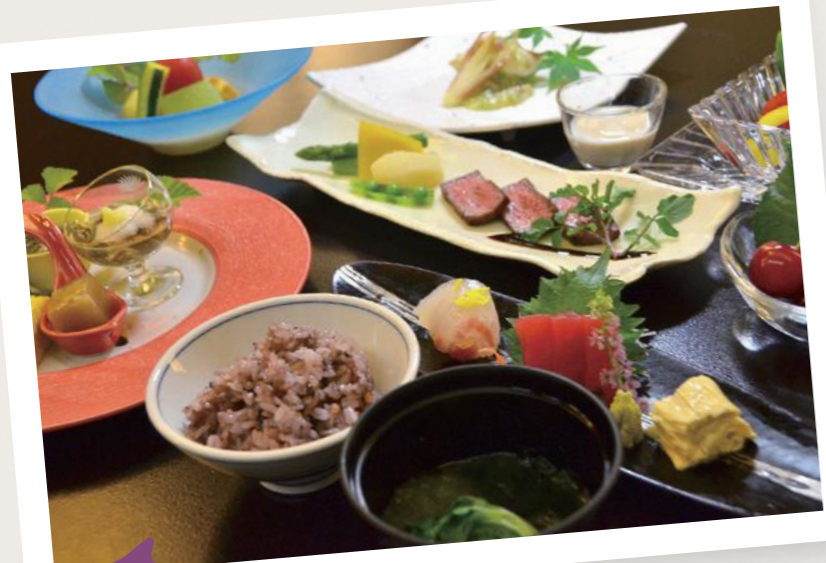
クアオルトバランス膳・早朝ウォーキング ●カロリー:622kcal ●塩分:2.7g ●野菜:268g