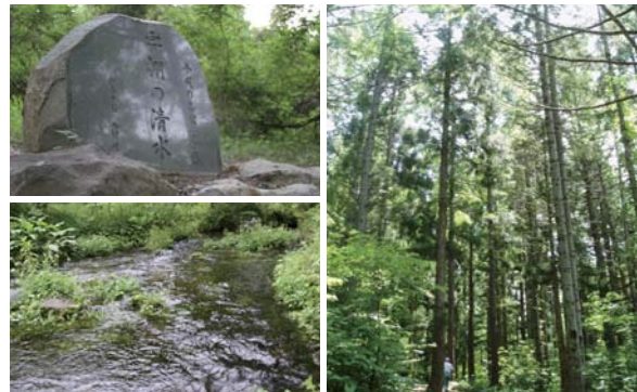
左上・下:平成の名水百選「宇棚の清水」、右:ドイツウヒ林