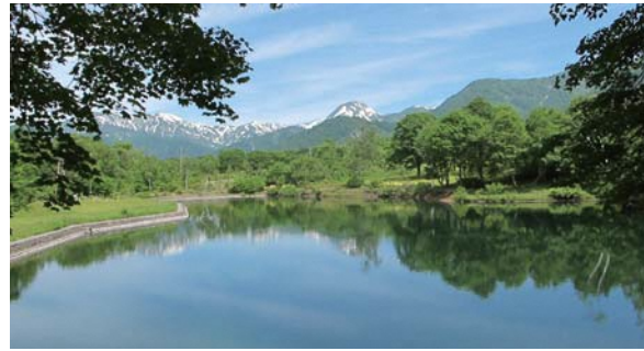
清水ヶ池からの眺め(地点⑪～⑫)

また、水源保全を目的に県の取り組みとして植えられたという日本最大のドイツウヒ林では、クアオルトの本場・ドイツに思いを馳せながら、歩いてみては。