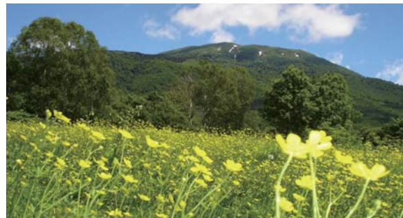
笹ヶ峰牧場周辺では、一面に黄色いキンポウゲが咲く(6月中旬～7月上旬)